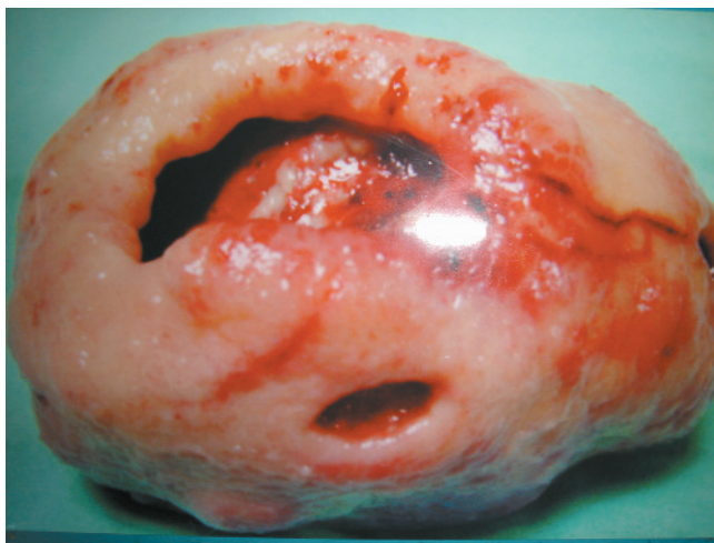
Figura 2. Masa ovoidea de 161 gramos, presentando gran cráter de 3,5 cm de diámetro con fondo sucio, fibrinoso, con bordes mamelonados y otra pequeña ulceración de 12 mm de diámetro, mal definida, que invade la serosa.