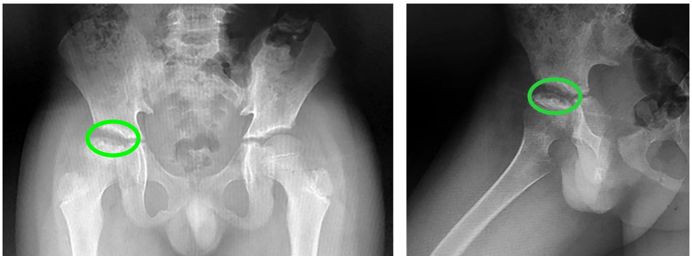
Figura 3. Radiografía AP y con rotación externa de la cadera año y medio después del diagnóstico.

La causa más común de hospitalización de un paciente con drepanocitosis es el dolor y su incidencia está relacionada con la presencia de conteos altos de leucocitos, bajo nivel de Hb F y alto nivel de hematocrito. Por lo general, los pacientes con Hb SC y Hb SB+ presentan menos episodios de dolor que aquellos con Hb SS y Hb SBO; sin embargo, todos los pacientes son diferentes y la forma en cómo se comporten puede diferir a lo que esta esperado según la literatura para su genotipo. 1 En el caso de la NAVCF, muchos son los factores predisponentes que se han señalado y pareciera ser que el más consistente entre los diversos estudios son las crisis vasooclusivas frecuentes y severas. 6